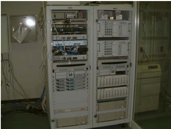
図3 平成13年 第3期KAINS

CPUを搭載したCPUが開発されるようになってきている。このような中で、平成18年2月に図4に示す第4期KAINSの構築を行った。