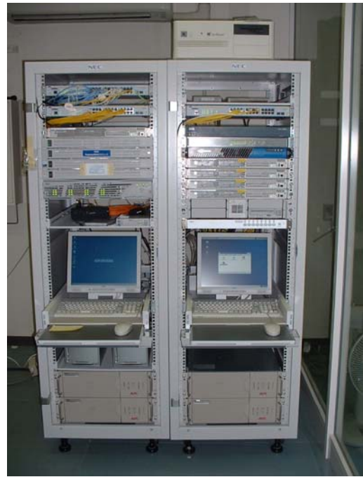
図4 平成18年 第4期KAINS