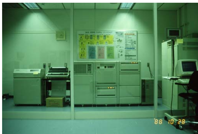
図1 昭和62年 VAX

示すパソコンLAN(第1期KAINS) 2) を構築した。第1期KAINSではインターネット(平成3年7月JUNETに参加)に接続し、すでに電子メールとネットニュースの利用を行っていた。その後のWWWの登場とWindowsへの移行により平成9年12月にTCP/IPプロトコルによるコンピュータネットワークシステム第2期KAINS 3) を構築した。第2期KAINSは、当センターの研究業務と事務処理のための重要な情報インフラとなり、構築に当たっては、職員の要望と技術動向の調査を行い、システムの基本設計を行った。平成13年12月に図3に示すWindows2000Serverを基幹ファイルサーバとし、Windows2000Professionalをクライアントパソコンとした第3期KAINSを構築した。第3期KAINS構築時はCPUクロックアップが顕著に行われ、パソコン購入から数ヶ月も経過しない間に劇的に改善されたCPUを搭載したパソコンが登場した。現在では、CPUのクロックは3GHzを超えたあたりから限界に近づきつつあるようで、1チップ上に複数個の