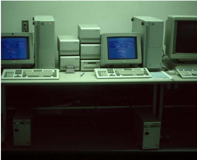
図2 平成4年 第1期KAINS