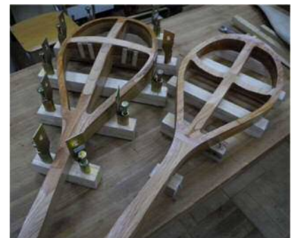
図4 収縮を妨げない開放型成形治具