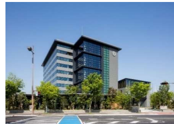
松尾建設株式会社 本店

山佐木材は、林野庁委託事業にて各種確認試験を実施、2016年5月、国交省より、CLT床2時間耐火構造の認定を取得しました。これにより耐火構造が求められる非住宅・中大規模建物の床に木造、鉄骨を問わずCLTを使用することが可能となりました。山佐木材は「超高層ビルに木材を使用する研究会」の設立に関わり、事務局、会員として「鋼構造オフィスビル床のCLT化」というテーマで現在も研究開発を推し進めております。松尾建設(株)様は、地球環境改善には欠かせない低炭素社会実現の一役を担う試みとして、5階建ての自社ビルの床に認定後初の2時間耐火CLT210mm厚を使用され、環境保護に積極的な企業としての取り組みを実施されました。