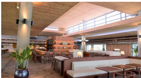
施工例: みやこ下地島空港 ターミナル