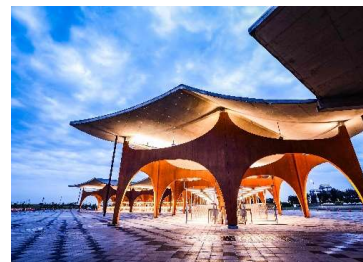
施工例: 新竹漁港観光拠点施設