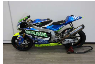
マルマエがスポンサーのオートバイ

マルマエはお客様の「困った」を技術で解決することで成長してきました。当社の技術基盤は、元レーサーの現社長が複雑形状のバイク部品を開発・製造することで培われ、当社の技術者たちが研鑽を重ねて日々進化しています。当社では、技術を闇雲に習うのではなく、物事の本質を見極め、自分自身で考えて生み出すことで技術を極めています。この技術と社員の努力によりお客様の信頼と支持を得て、継続した取引に繋がっています。自分たちの技術を使ってお客様に寄り添い、課題を解決する。その繰り返しの中で社会に貢献してまいります。