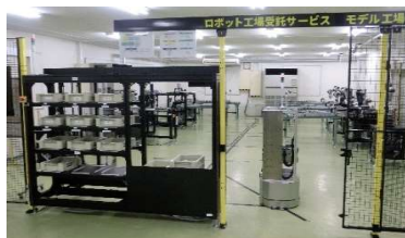
ロボット工場受託サービス モデル工場

自社でロボットを導入したいが、「導入費用が高く採算が合わない / 設置するスペースがない / ロボットに詳しい人材がない」などの理由で、二の足を踏んでいる事業者様も多いらっしゃいます。弊社は、そのような事業者様が、自動化・ロボット化の第一歩を踏み出すお手伝いとして、2021年から鹿児島溝辺工場で、ロボットによる受託生産サービスを開始しました。事業者様が、自社工場内にロボットを設置するのではなく、弊社の工場内の「ロボット工場受託サービス モデル工場」の設備を利用して、ロボットによる受託生産を行うサービスです。