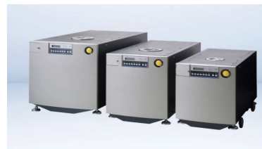
多段ルーツ型ドライ真空ポンプ

近年の大型化・微細化・高性能化・高品質化などの技術進歩に対し、真空技術は必須となりました。この真空を作り出すためのポンプや、真空制御するためのバルブも真空技術に対して不可欠な要素です。アルバックでは、長年の培ってきた技術で、真空という特殊な環境を作り出す装置・設備に搭載されるコンポーネントを供給しております。装置を支えるコンポーネントも進化を続けています。